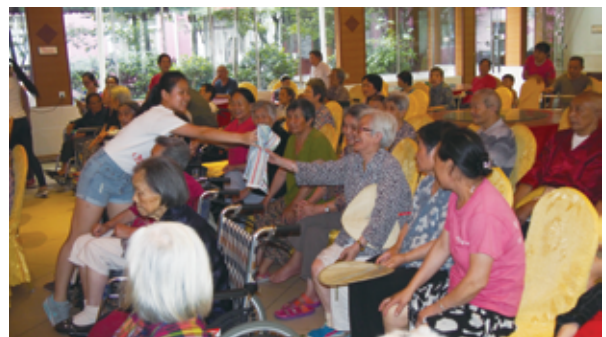
探訪老人院與院友玩遊戲

7月2日早上我們到達北川縣城地震現場遺址，同學都被現場所見震撼，來到512大地震公墓前大家都自發為死難者默哀。之後在一片廢墟中看到一個籃球架，導遊說下面埋了一所小學，地震發生時正值下午剛開始上課，所以有大量學生被埋。同學見證到大自然的威力，明白到人類的渺小及生命的無常。下午到達頤園養老院，我們十六位同學為院內60多位老人家預備了不同的表演活動及遊戲，為老人家帶來歡樂。期間他們還邀了一位七十多歲的婆婆一同唱歌，婆婆非常投入，歌聲悅耳，大家都唱得投入！