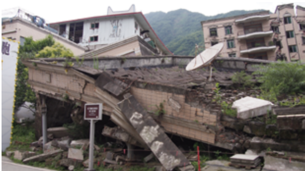
地震遺址令人深切體會到大自然的威力

五日四夜的行程當中，同學到訪過曾經發生大地震的四川省綿陽及北川，探訪當地村民，了解地震後災民如何走過傷痛重過新生活。同學亦探訪當地的特別貧困戶，了解他們的生活苦況並派發物資。另外，同學曾到成都一所安老院作探訪，為院社內的老人家安排活動。此外，同學參觀了大熊貓繁育研究基地、北川縣地震遺址現場、國粹川戲變臉表演、三峽博物館等。