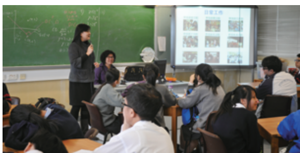
幼稚園校長講解幼兒教育工作

適逢本學年上水官立中學、粉嶺官立中學、新界鄉議局大埔區中學及龍翔官立中學都參加專業發展學校計劃，焦點是生涯規劃活動和課程，因而四間官立中學負責升