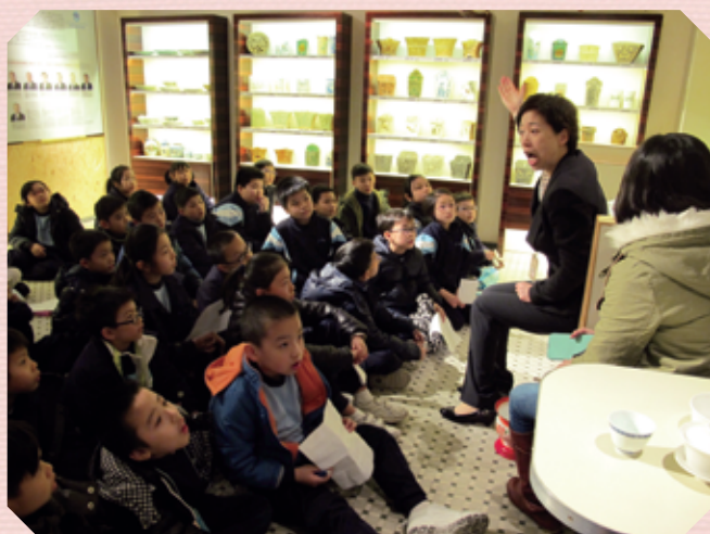
同學們用心聆聽導賞員講解本地飲食文化特色。