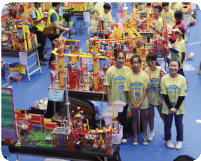
完成艱辛的搭建和評審，四位同學終於可以鬆一口氣。

我沒想過會得獎，因在流暢度上我們表現得不够好，不過我們還是很努力地說服評判，希望不會白費之前付出的時間、心思和努力。