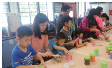
「親子溫馨」水晶果凍蠟製作班