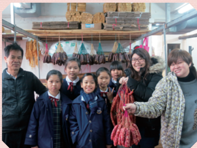
得到熱心家長的協助，學生能對「臘腸」的製作過程有了進一步的了解。