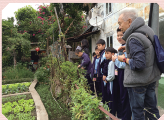
通過「薪火相傳」和「中西區導賞訓練計劃」，由中西區土生土長的長者與學生分享他們過往的精采生活。

本校獲邀參與「教會及學校」發展歷史文化徑的工作，並成為此文化徑的終點站，讓區內區外人士更深入了解中西區的歷史。長春社除了向本校提供專業意見，重塑校史廊外，更為學生提供導賞訓練及專題演講，於本校鑽禧校慶開放日擔任演講嘉賓，為「李陞與社區的演變」這個不一樣的專題研習，劃上一個完美的句號，亦為本校開展社區保育工作揭開新的一頁。