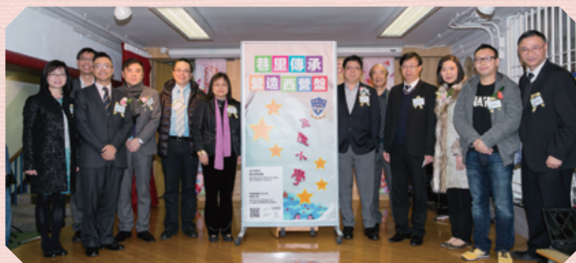
嘉賓濟濟一堂支持為期兩年的「巷里傳承·營造西營盤」社區保育計劃。

「懷舊美食大巡禮」。校方特意安排同學到一所飲食文化博物館參觀，讓他們探索本地獨有的飲食文化和特色，體驗人類飲食文化的睿智和趣味。小五及小六年級主題為「穿梭時空中西遊」。校方安排學生走訪中西區特色建築物及與本校校祖有關的街道，讓學生加深對學校歷史和中西區特色文化的認識。