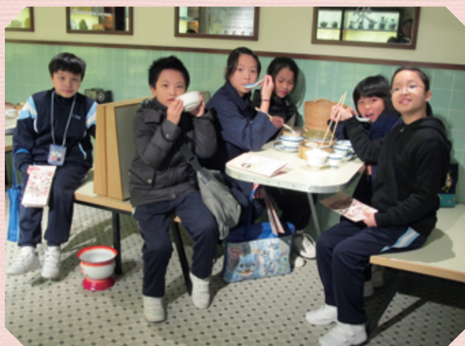
學生到飲食文化博物館參觀，探索本地獨有的飲食文化。