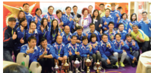
第七屆「五角球賽」教育局勇奪全場總冠軍